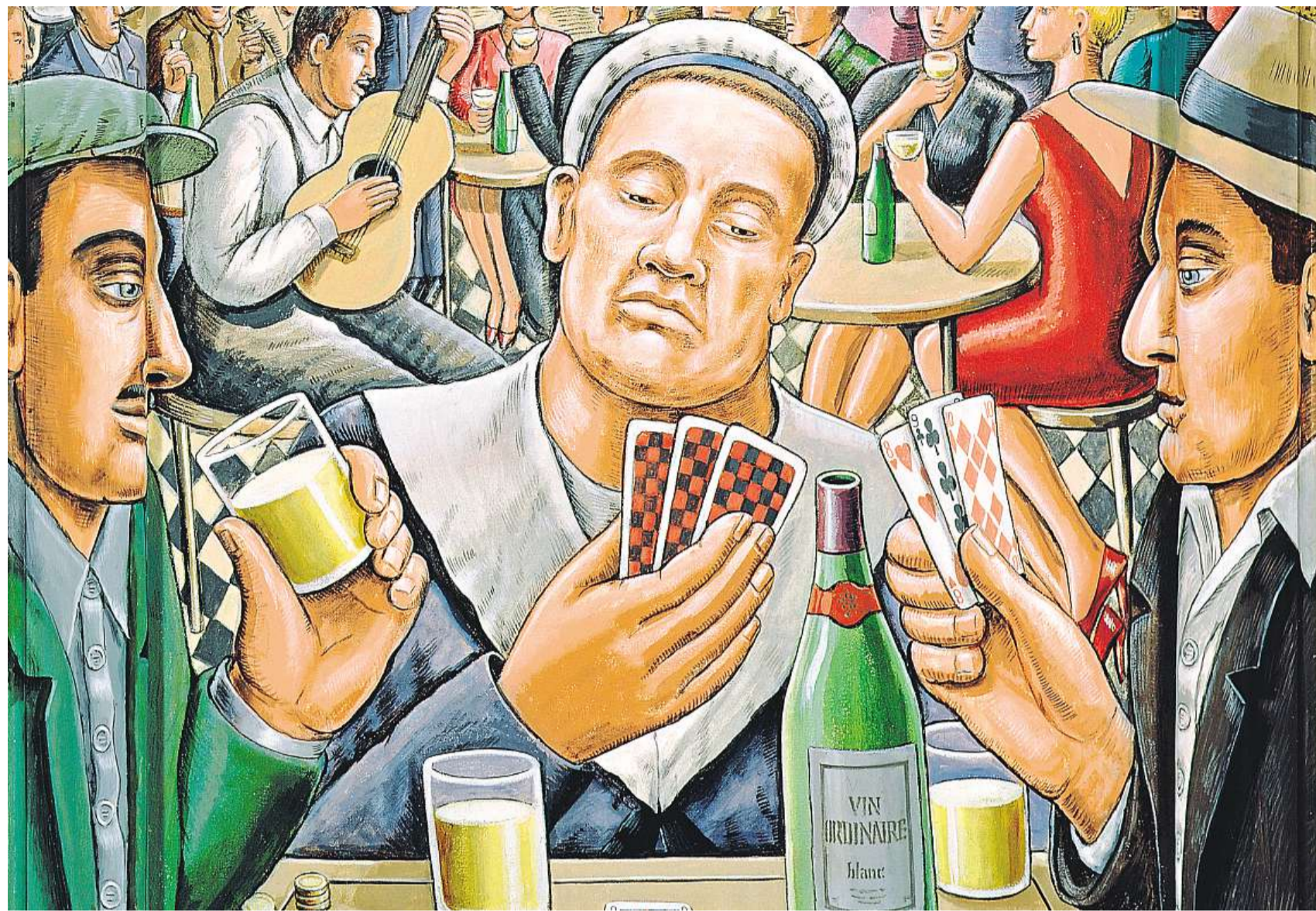
Hráči pokeru. Akryl na dřevě, P. J. Crook 2003.

Pro takový typ výzkumu, kdy je autor zároveň osobně angažovaným aktérem – a do hry tedy vstupují i jeho vlastní emoce – se v angloamerické terminologii vžil název autoetnografie. Kromě toho, že protagonisty tohoto přístupu vědomě pracují s pocity, jež v nich pobyt ve zkoumaném prostředí vyvolává (a činí je součástí svých interpretací), je typickým znakem emocionálně-antropologické autoetnografie i experimentální forma psaní. Tyto texty tak nezřídka nabývají (při zachování všech nutných vědeckých atributů) i zajímavých literárních kvalit. A někdy se jim dokonce podaří setřít rozdíl mezi vědeckou a krásnou literaturou.